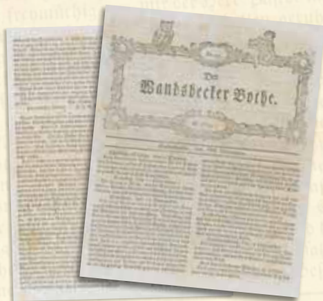
Der Wandsbecker Bothe, Ausgabe 191 aus dem Jahr 1772