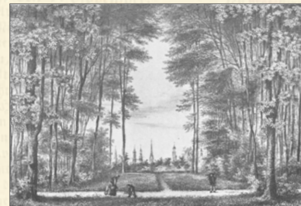
Durchsicht nach Hamburg im Wandsbeker Gehölz